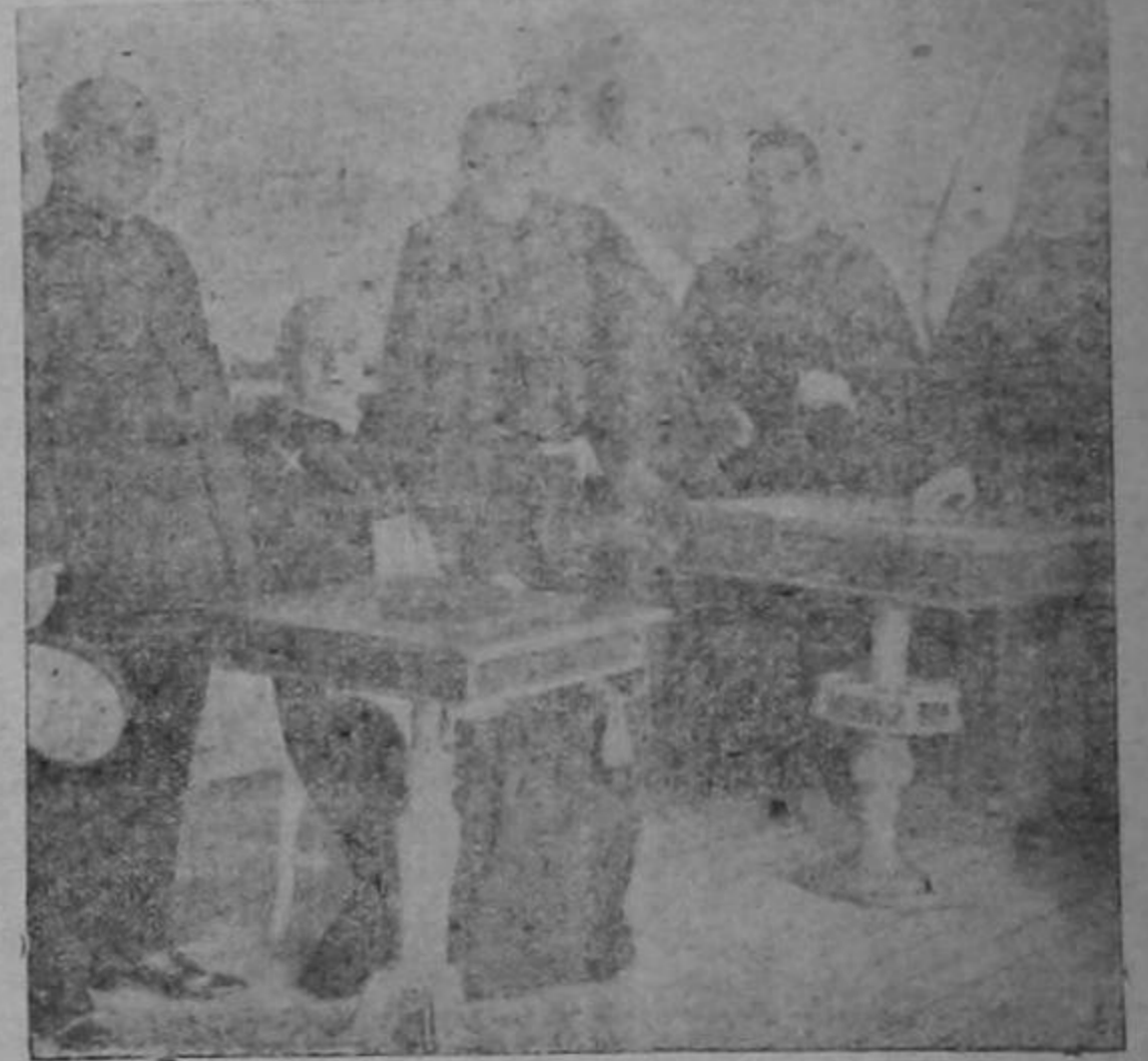
Monseñor Cagliero a bordo del "Umbria" al dirigirse a Roma en diciembre de 1915, para recibir el birrete cardenalicio

densada en un solo país. La selva, el caudaloso río, el monte gigante, el desierto, la llanura, todo es cruzado por Monseñor Cagliero, Argentina, Chile, Uruguay, Paraguay y el Brasil, todos son atravesados en todos los rumbos por el Obispo de Magida y por todas partes el símbolo del Cristianismo vence, y el Evangelio es predicado a los indios que lo quieren, que lo admiran y veneran.