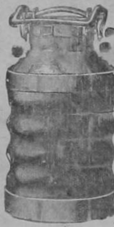
pinturas Alabastin etc.

Luego hará un corto viaje a Bluefields y luego se ocupará extensamente de nuestros asuntos de cañerías.